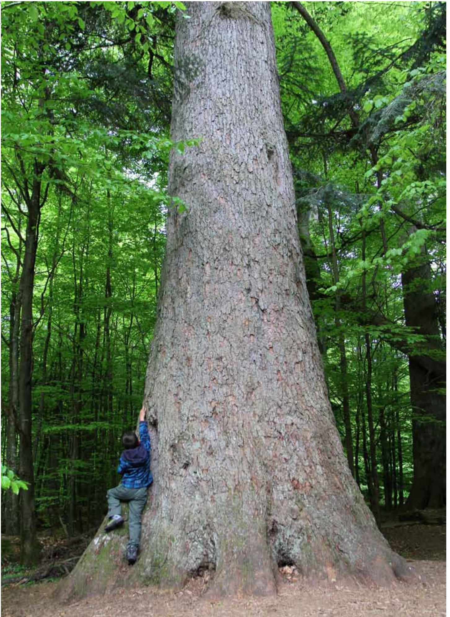
Nicht nur alte Bestände, auch einzelne Uraltbäume haben für die Artenvielfalt in Bergmischwäldern eine hohe Bedeutung. An der rund 600 Jahre alten Watzliktanne im Nationalpark Bayerischer Wald konnten an einem einzigen Tag insgesamt 2159 Tiere von 263 Arten nachgewiesen werden.