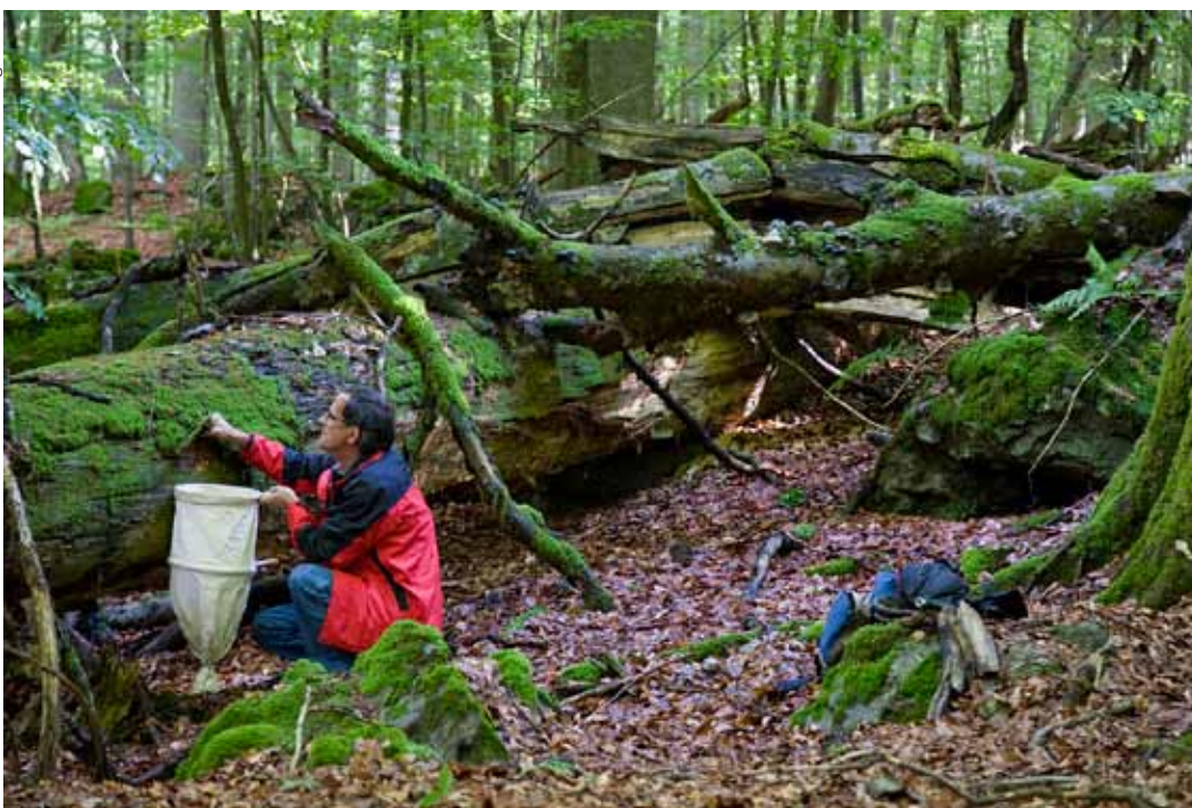
Links: Stark dimensioniertes liegendes Totholz weist eine kontinuierliche Feuchtigkeit auf, Lebensbedingungen, die die darauf spezialisierten Käferarten Gebirgshirschkäfer ( Ceruchus chrysolinus ), Danosoma fasciatum und Ampedus auripes (oben, von links) bevorzugen.